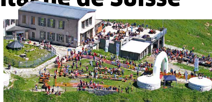
L'arrivée aux Rochers-de-Naye, après 18,8 km pour 1600 m de dénivelé.

AIGLE La 5 e des 8 manches du championnat romand de BMX se courra au Centre Mondial du Cyclisme le 26 juin, organisée par les 8 clubs membres de l'Association