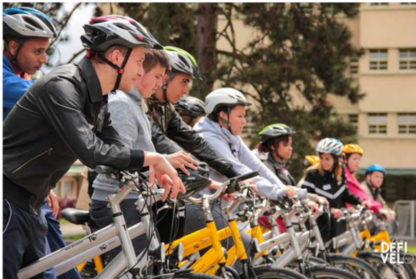
Schule und Velo (Symbolbild) - DEFI Velo

Für alle Veloförderungsangebote an Schulen gibt es eine neue Plattform: www.schule-velo.ch . Die Plattform soll einen Überblick über Programme und Kurse, die speziell für Schulklassen angeboten werden, schaffen.